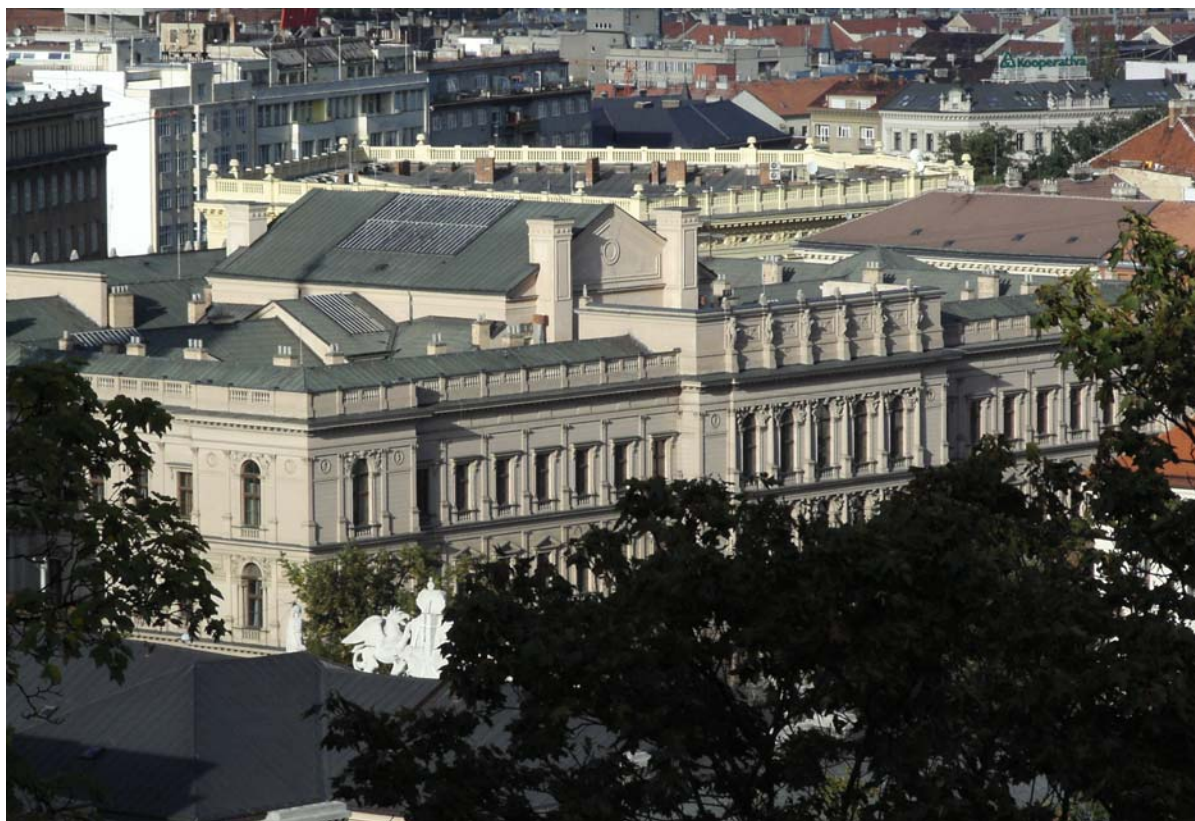
Sídlo Úřadu pro ochranu hospodářské soutěže

Důležitou skutečností nového zákona je zrušení zvýhodnění tuzemských uchazečů o zakázku . Předchozí právní úprava dále ani po četných novelizacích neodstranila některé nejasnosti při výkladu některých pojmů, což vedlo při aplikaci zákona k právní nejistotě, a tím k nadměrnému počtu žádostí o přezkum. Celý zadávací proces se tak neúměrně prodlužoval. V současné době se připravuje v souvislosti s přijetím nových směrnic ES č. 2004/17 ES a 2004/18 ES zcela nový zákon