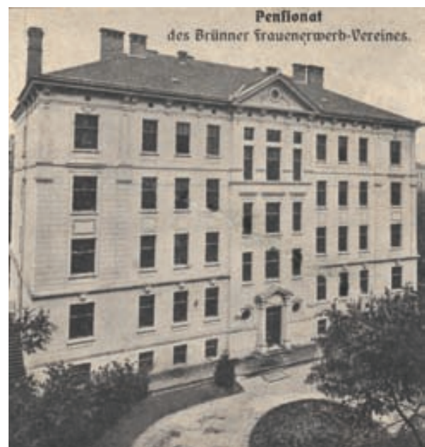
Historický záběr budovy penzionátu z počátku 20. století

Činnost Brünnner Frauenerwerb – Verein nijak neomezil ani převrat v roce 1918 a následný vznik Československa. Spolek se těšil nadále přízni vlivných mecenášů, mezi které patřilo tehdejší československé ministerstvo pro školství a lidovou kulturu, Moravský zemský výbor, město Brno, Československá obchodní komora nebo i rakouské ministerstvo školství. Mezi chovanky školy a penzionátu přitom nepatřily jen brněnské studentky, ale i dívky z okolí a vzdálenějších oblastí. Činnost obchodní školy byla rozšířena i na chlapce. Rozšířila se také pedagogická funkce penzionátu. Chovanky byly vzdělávány nově i ve hře na klavír, housle, mezi praxi