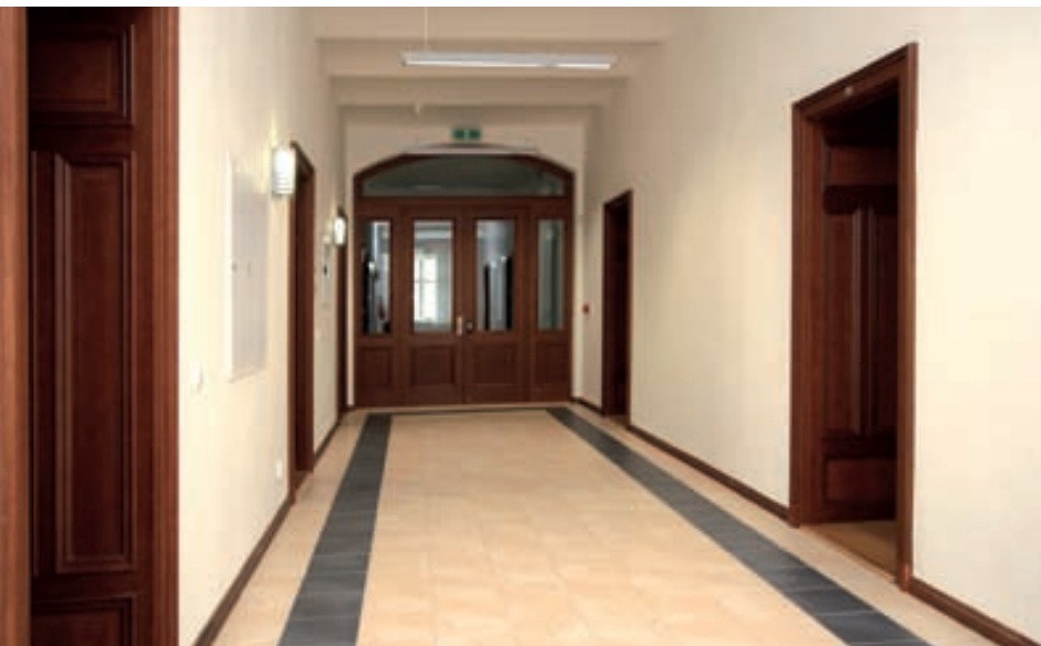
Chodba ve 2. patře