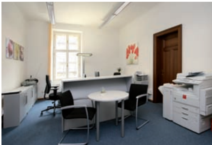
Sekretariát 1. místopředsedy