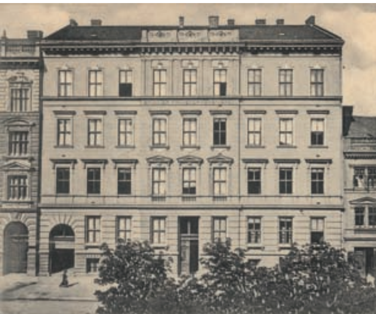
Školní budova Brüner Frauenwerb-Verein na počátku minulého století