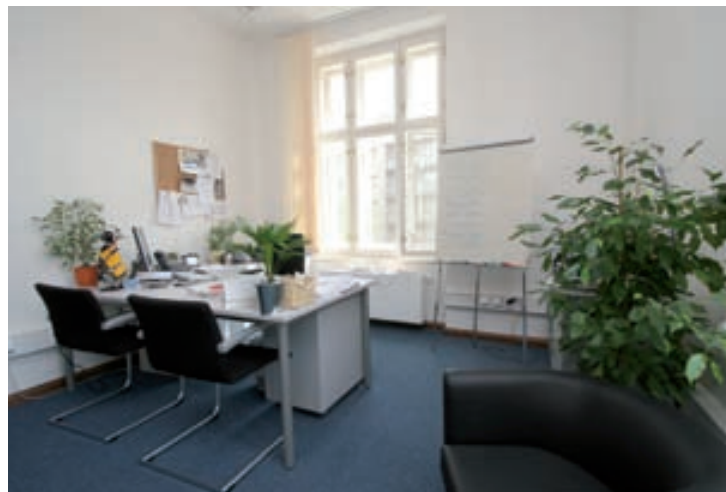
Pracovna ředitelky Sekce ochrany hospodářské soutěže II