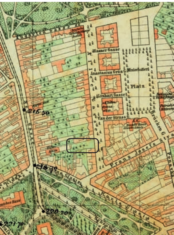
Výřez situačního plánu Brna z roku 1890 se zvýrazněným umístěním parcely, na níž dnes stojí nové sídlo ÚOHS

Podíváme-li se na situační plán Brna z roku 1890 zjistíme, že řada domů na tehdejší Schmerlingstrasse už v této době stála. Parcela u čísla 7 však zatím zela prázdnou. Z archivů a pozemkových knih můžeme vyčíst její někdejší vlastníky, od kterých v roce 1871 město parcelu koupilo. Pro další vývoj je však podstatný rok 1896.