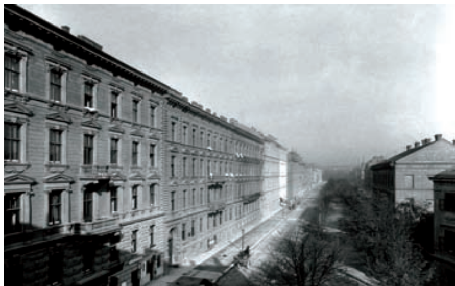
Celkový pohled na třídu Kpt. Jaroše z počátku 20. století

A ještě na něco nesmíme zapomenout. Už 24. 5. 1867 byla – tehdy ještě budoucí a zamýšlená – ulice