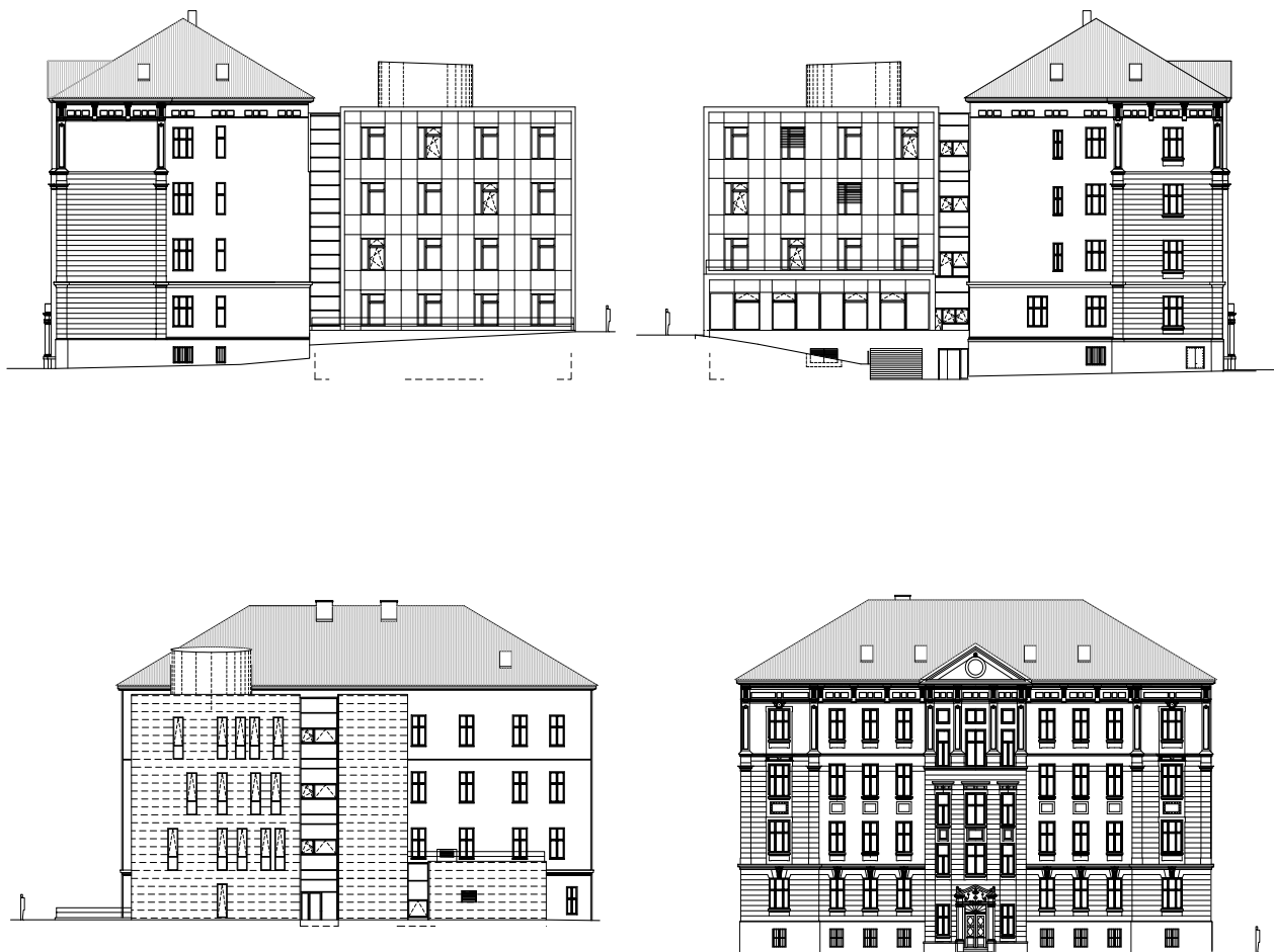
Architektonické plány rekonstruované budovy s moderní přístavbou

Úřad pro ochranu hospodářské soutěže (ÚOHS) získal budovu s pozemky pro zřízení svého sídla v roce 2005. Záměr a podmínky využití budovy byly projednány s Národním památkovým ústavem (NPÚ) a Magistrátem města Brna a byly stanoveny limity pro zásahy do stavby. Původní neorenesanční budova s výrazným průčelím opatřeným centrálním schodišťovým rizalitem obsahovala čtyři nadzemní a jedno podzemní podlaží s kolmě osazenou dvorní přístavbou sálového prostoru na přízemí. Půdní prostor vyplňoval dřevěný krov. Trojtrakt s vnitřní chodbou a místnostmi po obvodu pak nabízel logické využití s minimálním počtem dispozičních úprav, v interiéru dominantní schodišťový prostor s trojramenným schodištěm měl zůstat jako ústřední komunikační prostor. Projektové práce provedla firma MORAVIA CONSULT Olomouc a.s. jako vítěz výběrového řízení na zpracování dokumentace stavby, obsahem dokumentace byl také architektonický návrh na úpravy objektu a jeho dostavbu - nároky na umístění potřebného