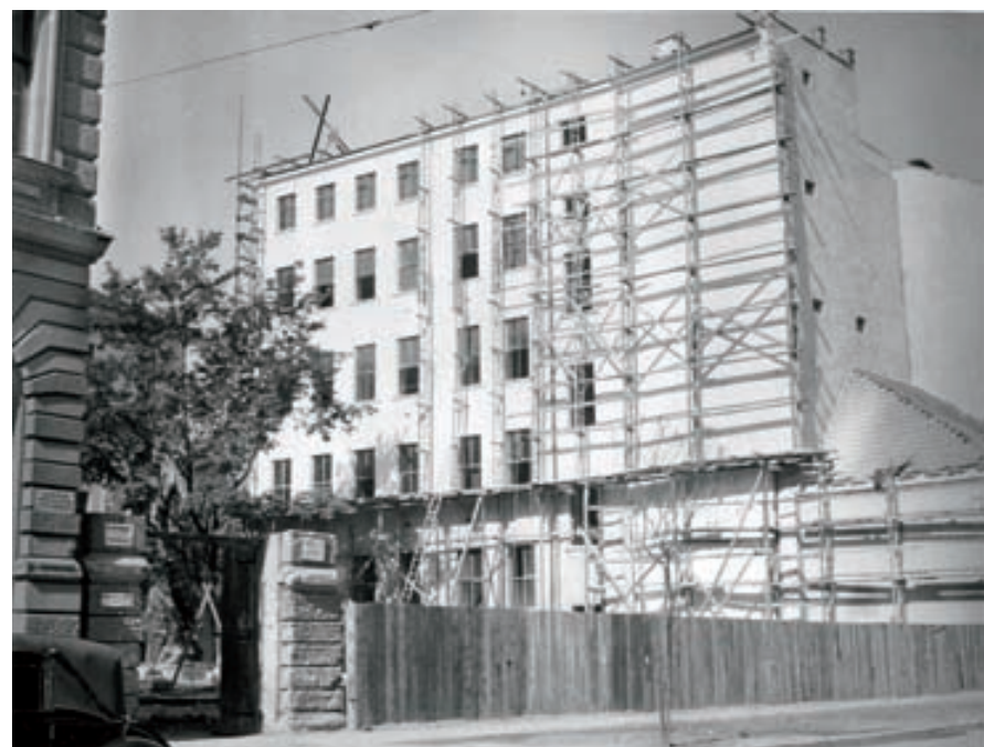
V roce 1946 byla poničená budova školy Bünner Frauenerwerb-Verein zdemolována a po dvě desetiletí zela na jejím místě proluka