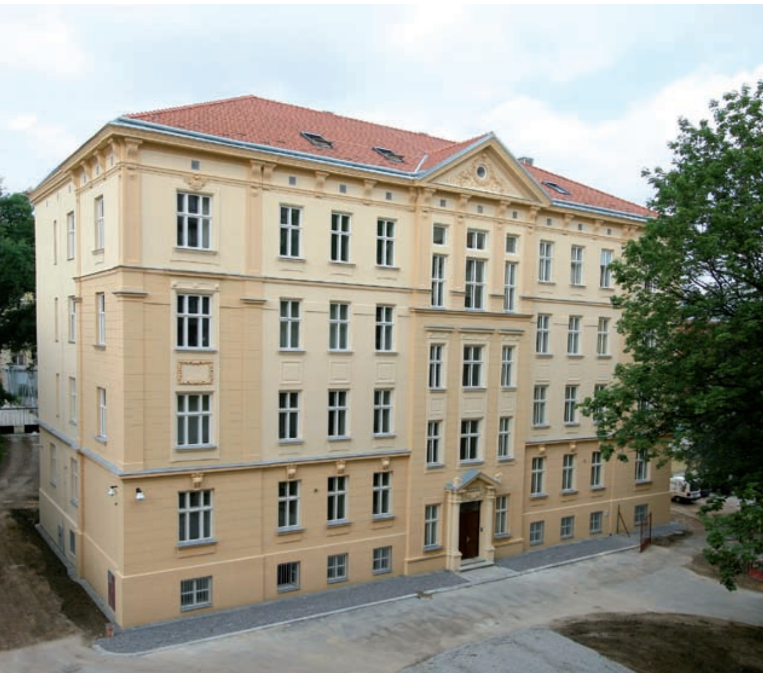
Celkový pohled na nové sídlo Úřadu