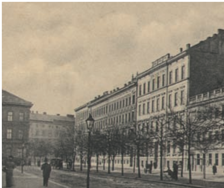
Celkový záběr na třídu Kpt. Jaroše na dobové pohlednici z přelomu 19. a 20. století