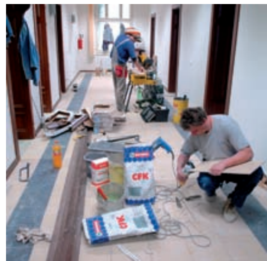
Na jaře 2007 probíhaly závěrečné práce na interiéru budovy a dokončovala se fasáda sídla

V říjnu roku 2006 jsme zahájili rozsáhlou rekonstrukci budovy bývalé vojenské správy na třídě Kpt. Jaroše 7, která se po dokončení stala novým sídlem Úřadu pro ochranu hospodářské soutěže. Již 20. března 2007 proběhla úspěšná kolaudace stavby. Vnější fasáda budovy byla dokončena v květnu tohoto roku.