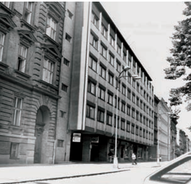
Koncem 60. let zaplnila proluku moderní budova silně narušující novorenesanční charakter třídy Kpt. Jaroše

ústavu patřily společné návštěvy divadelních představení, koncertů. Do vybavení penzionátu náležel i „čtyřlampový radioaparát“, který zprostředkoval přednáškové programy různých vysílacích stanic. Nezapomínalo se ani na sporty jako bruslení, sáňkování, lyžování nebo tenis.