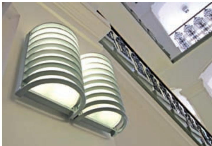
Moderní design svítidel kontrastuje s původními architektonickými prvky

1991 Jedním z prvních opatření zaměřených na podporu budování tržního hospodářství v České republice po roce 1989 bylo přijetí právní úpravy ochrany hospodářské soutěže. Zákon Federálního shromáždění o ochraně hospodářské soutěže, který nabyl účinnosti 1.3. 1991, stanovil, že podstatnou část této působnosti na území ČR bude vykonávat orgán pro hospodářskou soutěž České republiky. Jeho sídlem se nestalo hlavní město Praha, jako centrum klíčových orgánů státní správy, ale Brno, což deklaruje nezávislost v rozhodování. Dalším důvodem byla i skutečnost, že se v té době jihomoravská metropole stávala justičním centrem naší země. Český úřad pro hospodářskou soutěž zahájil svou činnost 1. 7. 1991 a jeho předsedou a pozdějším ministrem byl Stanislav Bělehrádek. Úřad byl zpočátku stejně jako jeho slovenský protějšek podřízen Federálnímu úřadu pro hospodářskou soutěž se sídlem v Bratislavě, který vedl od 18. 1. 1991 Imrich Flassik, jehož v období od 2. 7. 1992 do 29. 10. 1992 vystřídal Milan Čič. Úřad od počátku sídlil v pronajatých prostorách v budově Ústavního soudu na Joštově ulici č. 8. Od roku 1991 až do současnosti má ÚOHS detašované pracoviště v Praze v Letenské 3, kde nyní funguje odbor veřejných zakázek.