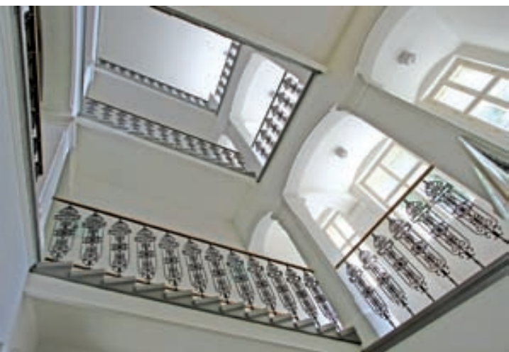
Historické schodiště bylo rekonstruováno dle nalezených originálních dílů z počátku 20. století