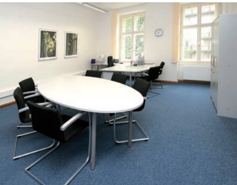
Pracovna ředitele Kabinetu předsedy