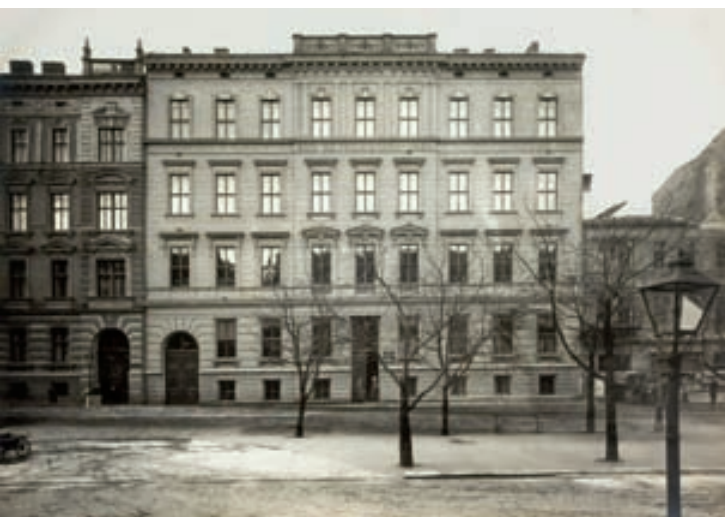
Hlavní budova školy spolku Brünner Frauenerwerb na dnešní třídě Kpt. Jaroše 7 (snímek je patrně z roku 1907)