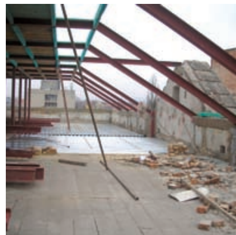
Fotografie z průběhu rekonstrukce

počtu pracovníků zřetelně ukazovaly, že stávající prostory nebudou pro daný účel dostačovat. Po vyhodnocení využitelných ploch podlaží bylo jasné, že nová přístavba nebude malá. Stísněné podmínky zadních svažitých pozemků a urbanistická návaznost sousedních staveb předurčily umístění přístavby do dvorní části, ve které se nacházela z památkového hlediska nepříliš zajímavá přístavba sálu. Variantní objemové a zastavovací studie prokázaly, že její poloha negativně determinuje využití pozemku pro novou přístavbu, a proto po dohodě s NPÚ byla navržena k demolici. Uvolněná dvorní část pak byla využita beze zbytku pro umístění nové čtyřpodlažní přístavby, uložené na podnoži podzemních garáží.