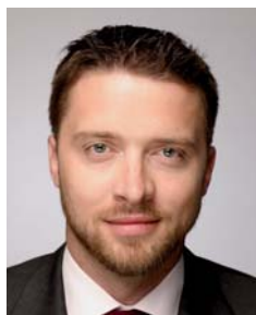
Jan Sixta náměstek ministra pro místní rozvoj

Po absolvování Právnické fakulty Univerzity Karlovy pracoval krátce jako právník zabývající se veřejnými zakázkami na Ministerstvu pro místní rozvoj a posléze se v Agentuře pro podporu podnikání a investic CzechInvest podílel jako ředitel právního odboru na významných zahraničních investičních projektech. V současné době je náměstkem ministra pro místní rozvoj odpovědným za veřejné investování a legislativu. Byl členem přípravného týmu zákona č. 137/2006 Sb., o veřejných zakázkách, a nadále odpovídá za jeho změny a novelizace. Jan Sixta je zástupcem České republiky v mezinárodních pracovních skupinách pro veřejné zakázky v rámci Evropské unie, WTO či UNCITRAL.